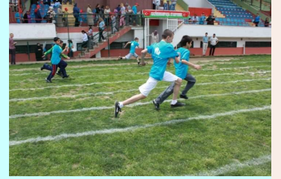
Gaziosmanpaşa 4. Özel Eğitim Şenliğinden

Ülkemizdeki birçok il/ilçe gibi Gaziosmanpaşa ilçemiz de özel eğitimle ilgili atak/büyüme dönemi, 2005 yılında yayımlanan 5378 sayılı Özürlüler ve Bazı Kanun ve Kanun Hükmünde Kararnelerde Değişiklik Yapılması Hakkındaki Kanun'la birlikte hayata geçmiştir. Bu kanunla özellikle ulaşılabilirlik, istihdam, bakım ve sosyal güvenliğe ilişkin sorunların çözümü, engelli bireylerin gelişmeleri, toplumsal hayata tam katılımlarının sağlanması hedeflenmiştir. Böylelikle yasa ile getirilen çağdaş düzenlemelerin uygulanması sağlanarak engelli bireylerin önündeki engellerin kaldırılması yönünde son derece önemli adımlar atılmıştır. (Devamı arka sayfada)